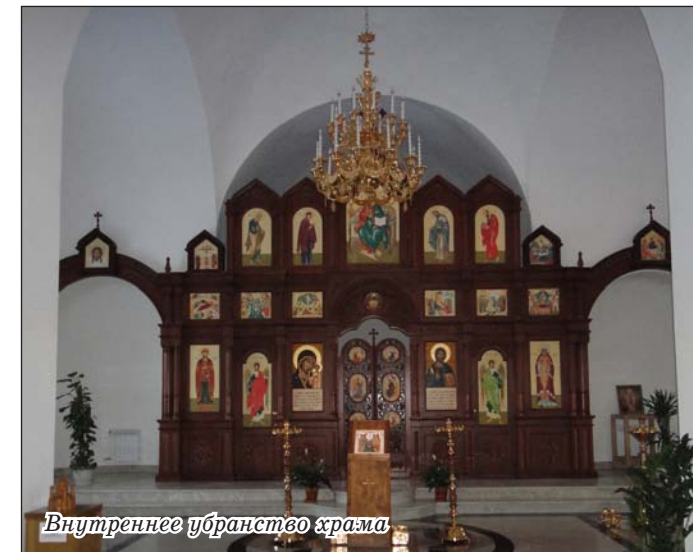
Внутреннее убранство храма

Беседовала Светлана Калашник