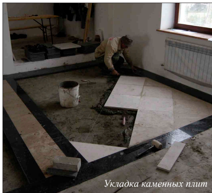
Укладка каменных плит

Татьяна Балака