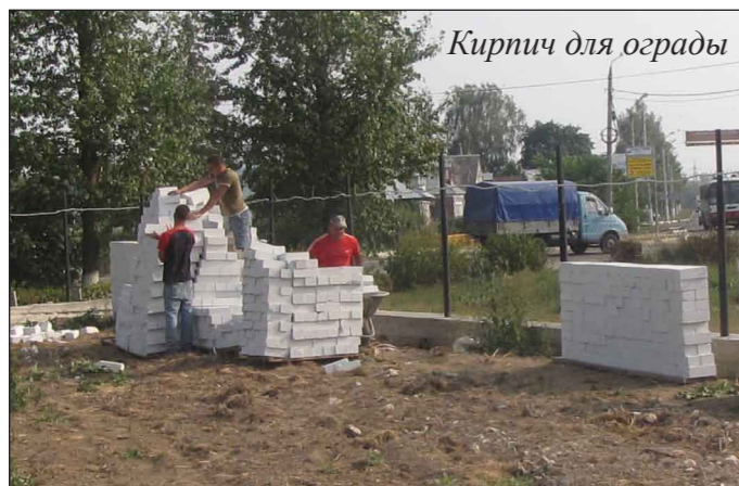
Кирпич для ограды