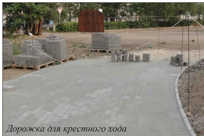
Дорожка для крестного хода

Татьяна Балака