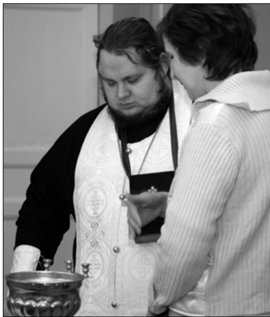
Беседа с прихожанами

— Мое отношение как священника, внушать веру в Деда Мороза — это не правильно. В разных странах мира этот мифический герой называется по-разному. Существует святитель Николай, который помогал нуждающимся. Но он не имеет ничего общего с Дедом Морозом. Внушать веру в Бога — это правильно. Получить подарок на Рождество — это награда за ту, пусть маленькую работу, которую делает ребенок. Каждое доброе дело вознаграждается Богом, а дети получают данный Богом