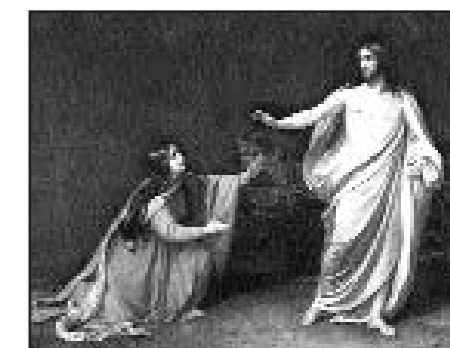
А. А. Иванов. «Явление Христа Марии Магдалине после Воскресения»

Жены-мироносицы несли алавастровые сосуды с миром, чтобы ароматами умастить пострадавшее тело распятого на кресте за грехи всего мира Спасителя нашего. Будем же и мы нести мир нашей любви, нашего милосердия, нашего