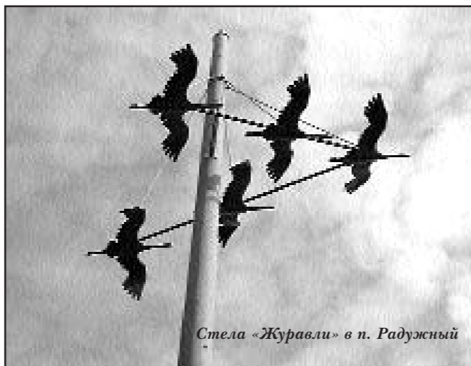
Стела «Журавли» в п. Радужный

– На фронте каждый день отдельная история.... В основном служба проходила в разведгруппе. Устраивали засады, прокрадывались в тыл