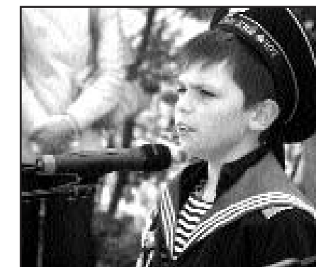
Музыкальное поздравление ветеранам от подрастающего поколения